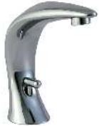
BONN (INCLUYE DESAGÜE AUTOMÁTICO)