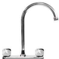
MEZCLADORA PARA COCINA