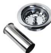
CONTRACANASTA ACERO INOXIDABLE

CON TUBO 08500 50 114.63 BASE P.V.C. CON TUBO P.V.C. 08501 50 62.30