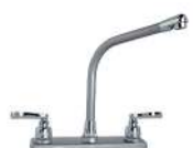
MEZCLADORA PARA COCINA "HELIO", VÁSTAGO CERÁMICO