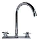
"DION" MEZCLADORA DE COCINA VÁSTAGO 1/4 DE VUELTA CUBIERTA METÁLICA CON AERADOR