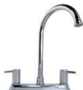
MEZCLADORA PARA COCINA "HIBRIS"