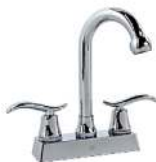
MEZCLADORA PARA LAVABO "ENNA" CUERPO LATÓN

CROMO 04488 12 811.44 SATÍN PULIDO 04468 20 520.25 CROMO COMPACTA CUB. ABS 04498 20 408.37