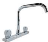
"METIS" MEZCLADORA DE COCINA VÁSTAGO 1/4 DE VUELTA CUBIERTA METÁLICA CON AERADOR