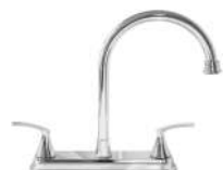
MEZCLADORA PARA COCINA "DELIO" CROMO