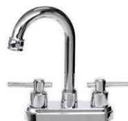
MEZCLADORA PARA LAVABO