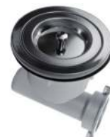
CONTRACANASTA ACERO INOXIDABLE

C/ TUBO DE POLIPROPILENO 08506 50 144.81