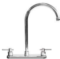
MEZCLADORA PARA COCINA