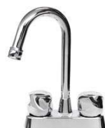
MEZCLADORA PARA LAVABO