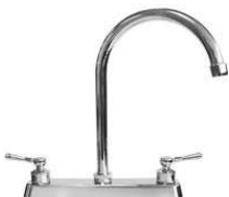
MEZCLADORA PARA COCINA