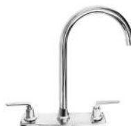
MEZCLADORA PARA COCINA "FENICE"