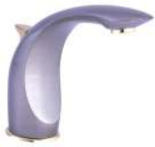
NÁPOLES (INCLUYE DESAGÜE AUTOMÁTICO)