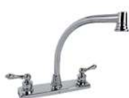
"HERA" MEZCLADORA DE COCINA VÁSTAGO 1/4 DE VUELTA CUBIERTA METÁLICA CON AERADOR