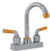
TIPO BAR, 2 TONOS MANERAL TIPO PALANCA, VÁSTAGO 1/4 DE VUELTA CON AERADOR