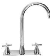
MEZCLADORA PARA COCINA "ARIZBA"