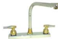
TIPO COBRA VÁSTAGO 1/4 VUELTA, CUERPO LATÓN, CUBIERTA METÁLICA