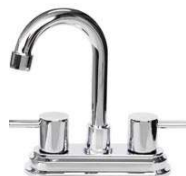
MEZCLADORA PARA LAVABO