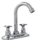
MEZCLADORA DECORATIVA PARA LAVABO "SHANI"