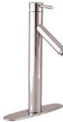
MONOMANDO MINIMALISTA CORVUS (INCLUYE CUBIERTA 8")