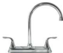
MEZCLADORA PARA COCINA "BURA"