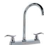
MEZCLADORA PARA COCINA "ENNA"

C/ TUBO DE POLIPROPILENO 08506 50 144.81