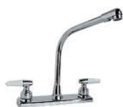
TIPO COBRA, 1/4 DE VUELTA, CUBIERTA METÁLICA CUERPO UNA SOLA PIEZA NARIZ METÁLICA