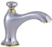
TANGER (INCLUYE DESAGÜE AUTOMÁTICO)