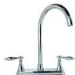
MEZCLADORA PARA COCINA "EUROPA", VÁSTAGO CERÁMICO